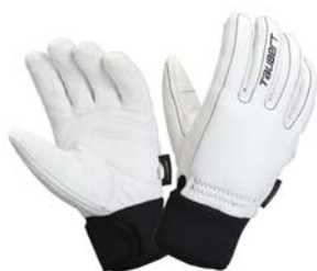
ホワイト/ブラック

山羊革を使用した NEW モデル。 シンプルなデザインを採用し、ステッチのカラーでアクセントをつけました。 防水透湿性に優れたサイトスフィルムをインサートしています。 はめ心地の良い暖かいグローブに仕上げています。