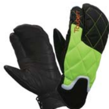
フラッシュライム