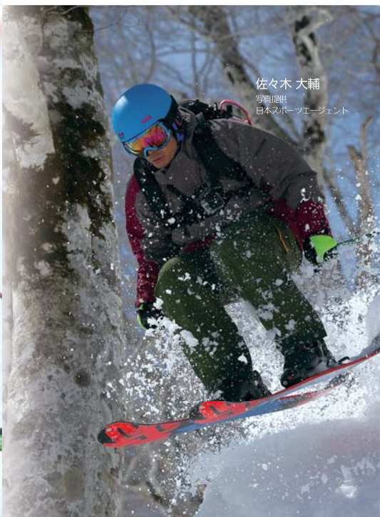
佐々木 大輔