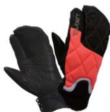
フラッシュオレンジ