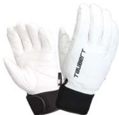
ホワイト/ブラック