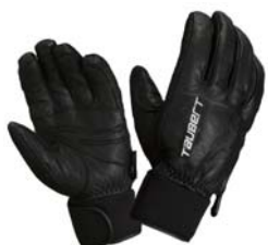
ブラック/ホワイト

革の繊維全体に防水処理仕上げされた良質でソフトな牛革を使用し、グリップに優れたグローブです。防水・透湿性に優れたインナーフィルムを採用し、中綿には薄くて暖かいシンサレートを_using_しています。ピタッとした感覚が好きな方に、特にオススメです。選手に人気のモデルです。